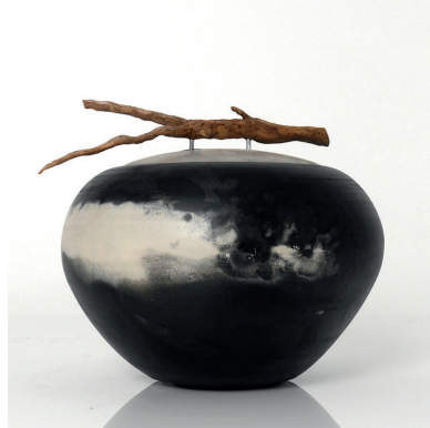
ANTON VAN EYK† KERAMIK